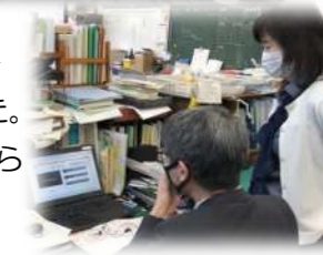
動画撮影編集の研修中→

2月に花を咲かせていた中庭の梅の実が大きくなってきました。もうすぐ「梅雨」。梅雨明けとともにコロナも連れ去ってくれたらと祈るばかりです。