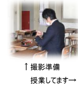
↑撮影準備 授業してます→