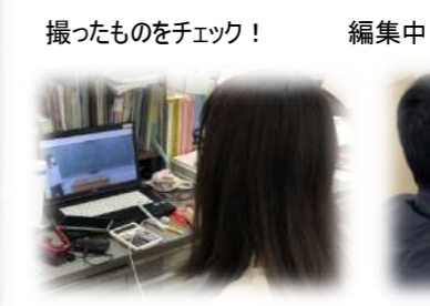
撮ったものをチェック！ 編集集中