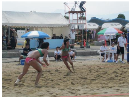
H24 女子バレー部 全国大会のようす