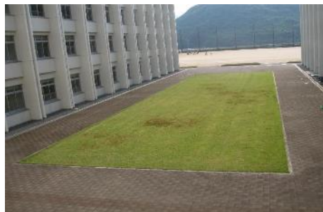
平成29年5月30日現在の写真