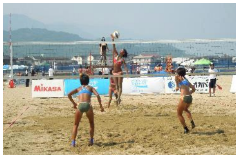
H27 女子バレー部 全国大会のようす