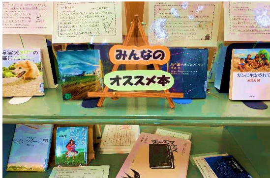
▲おすすめ本コーナー。2月上旬完成予定。