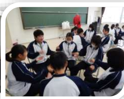
レクリエーション実技