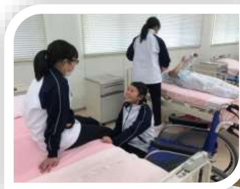
車いすへの移乗支援