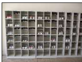
自転車置き場も靴箱も「疎」です。