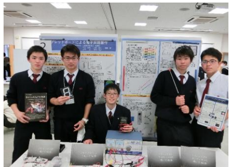
発表終了② 今回得られたことを、この後に控える校内での課題研究発表会に活かしていきたいです。