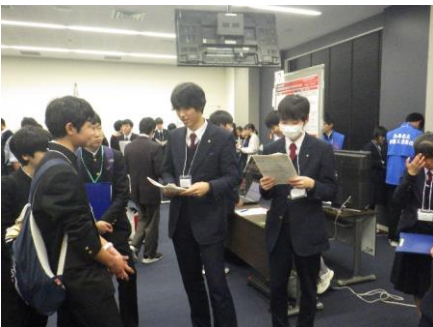
意見交換 高校生や先生に様々な質問やアドバイスをもらいました。活発な議論ができました。