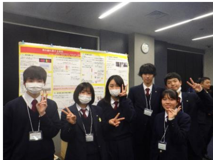
発表終了① 発表を通して、色々な意見をもらったことで、自分たちの研究について、より理解が深まりました。