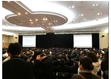
開会式 開会式の様子です。全県からたくさんの方々が参加していて、規模の大きさに驚きました。