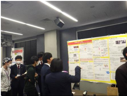
ポスター発表② 紫外線班はポスターの内容を中心に自分たちで分析したデータを紹介しました。