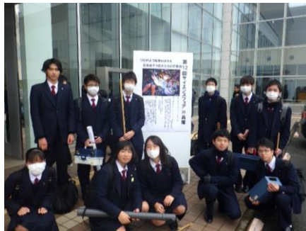
サイエンスフェア in 兵庫 いよいよ本番を迎えました。神戸のポートアイランドに集合です。今日は精一杯頑張ります！