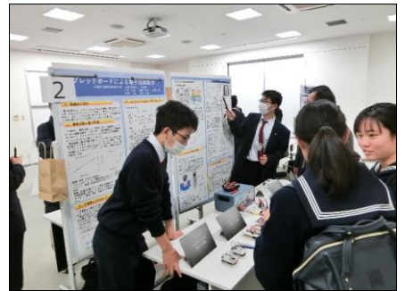
ポスター発表③ 電気班は自分たちが作成した回路を実際に見てもらいながら、研究内容を紹介しました。