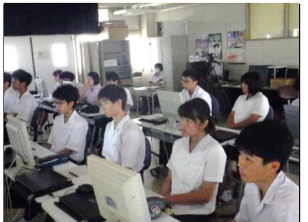
講義を受けるSSC 2年生 知っている植物や動物を例に、興味深い話をたくさん聞くことができました。