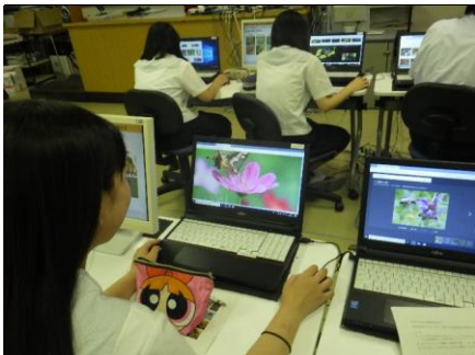
花と送粉者の画像を検索 虫や鳥が花と一緒に写っている画像をネットで検索し、データを集めます。