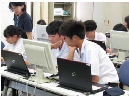
班でデータを集める 班ごとに集めたデータをまとめます。どんな結果になるのか楽しみです。