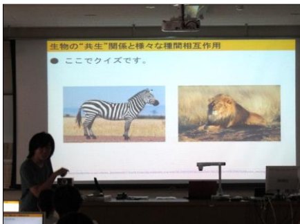
生き物たちの関わり合い 生き物たちの関わり合い「共生」をテーマに、色んな具体例を挙げて説明していただきました。