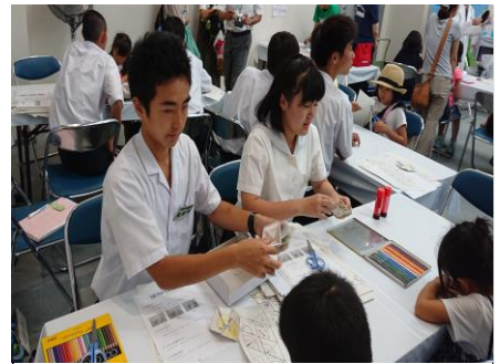
どれにしようかな？

6つの図柄から一つ選んでもらいます。自分の考えた絵柄が選ばれるかドキドキワクワク。