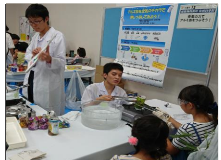
自然科学部も頑張りました！