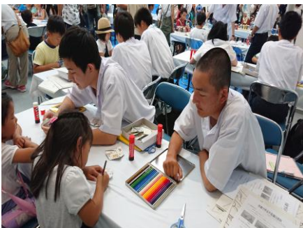
仕上げの色塗りです