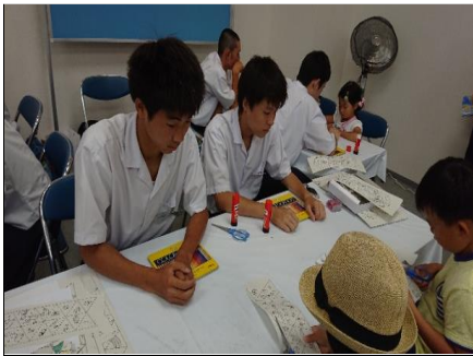
はさみで切って・・・

6つの図柄から一つ選んでもらいます。自分の考えた絵柄が選ばれるかドキドキワクワク。