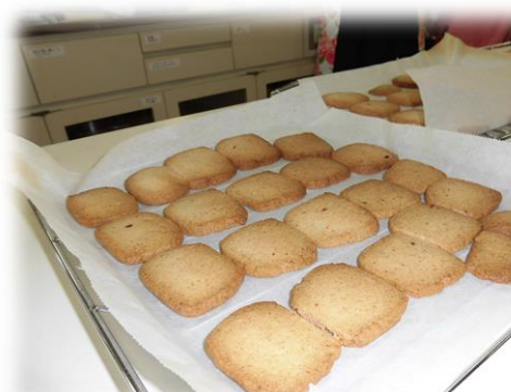
あ、イチゴの香りがする。この甘酸っぱさも！