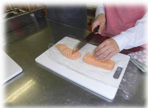
生地の色がきれいですね～♪