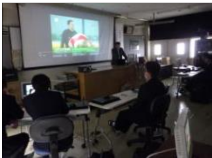
心停止の突然死について 喫煙は周りの人にも悪影響を与えます。受動喫煙者の肺が時間につれて悪化しています。