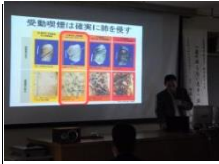
受動喫煙の危険性 喫煙は周りの人にも悪影響を与えます。受動喫煙者の肺が時間につれて悪化しています。