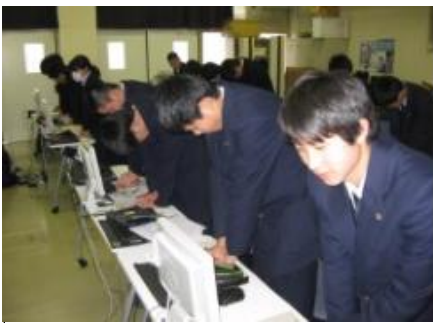
心肺蘇生法について テーブルに心停止の人がいることを想定し、心臓マッサージの練習をしています。