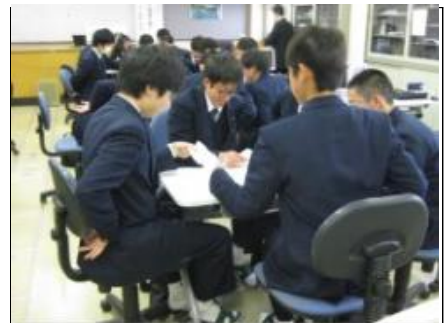
グループ学習1 5人グループになって協力しあい、意思疎通の大切さやリーダーシップの必要性を学びました。