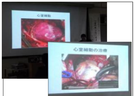
心室細動について 正常に心臓が動かなくなってしまう心室細動について、動画で実際の心臓の動きを見ました。