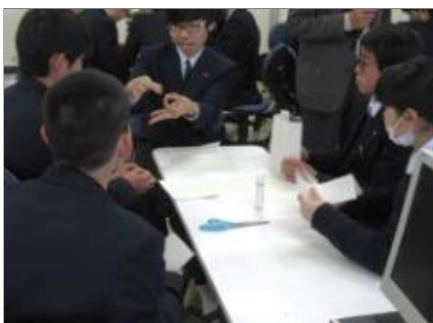
グループ学習2 グループ学習の回数が増えるにつれて、スムーズに作業を進められるようになりました。