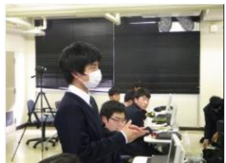
質疑応答 カテーテルでの手術において、心臓弁の取り付け方について、質問をしています。