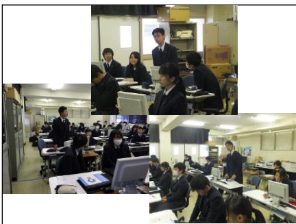
質疑応答 スライド作成や発表のことに注意しなければいけないことなど、たくさん疑問を先生に質問しました。