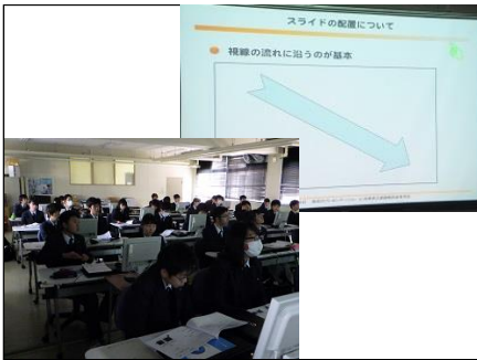
プレゼンテーション(スライド制作) スライドの制作について、配置・字体・大きさなど、見やすく分かりやすい提示を学びました。