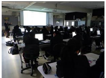
身振り手振りを交えての講義 分かりやすく、身振り手振りを交えて、テンポ良くいろいろな手法を教えてくださいました。