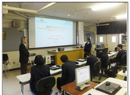
謝辞 発表会では、先生に教えていただいたことを工夫して、魅力的な発表をしたいと約束しました。