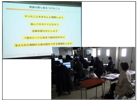
会場の様子② 発表で気をつけることは、発表者が研究内容について目的から考察まできちんと理解していること。