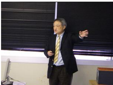
詳しい回答 質問に対して、具体的に詳しく丁寧な回答していただき、しっかりと理解できました。