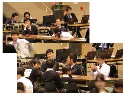
チャレンジマッチ

お昼ご飯でリラックス。食事は和気藹々と。冷静で穏やかな気持ちになって午後に臨みます。