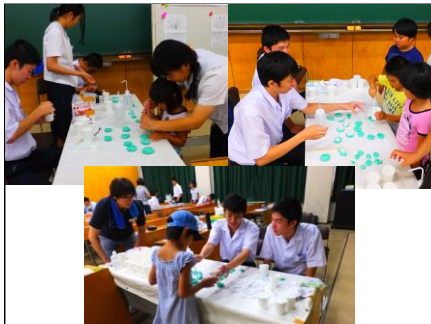
「化石のレプリカをつくろう」③ 工作に興味をもって楽しんでしてもらえるように、細やかにアドバイスをします。