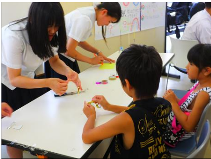
「虹をつくってみよう!」③ 光や色の原理を分かったあとは、自然光から虹を見ることができる作品を工作します。