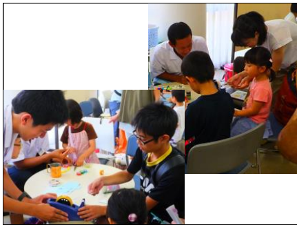
「虹をつくってみよう!」④ 工作手順を分かりやすく説明し、子どもたちがけがをしないように、工作と一緒に楽しみました。