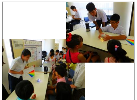
「虹をつくってみよう!」② 最初はクイズ形式で光の性質について、それを演示して、子どもたちに分かってもらいます。