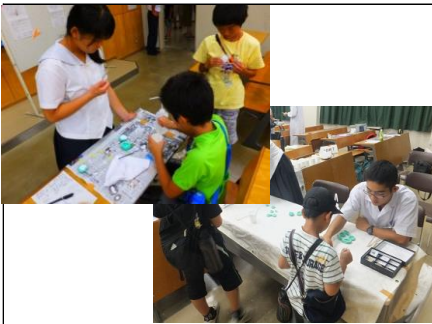
「化石のレプリカをつくろう」② スピリファー、三葉虫、アンモナイトから、自分の好きな生物の型を選び、石膏を流し込みます。