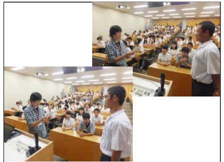
閉会式 物理班・地学班に、実行委員会より感謝状をいただきました。