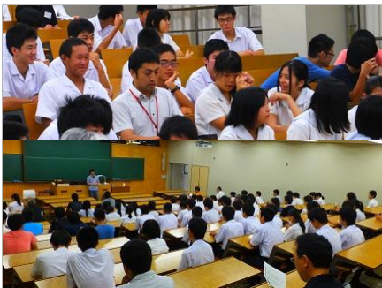
開会式 いろいろな学校・企業が出展しています。SSCは、他校との交流を深めることも目的にしています。

SSC 2 年生 自然科学探究Ⅱ 課題研究班は、物理班「虹をつくってみよう!」、地学班「化石のレプリカをつくろう」でブース出展しました。工作実験を通して子どもたちに科学の面白さを伝えるとともに教えることの難しさも知ることができました。