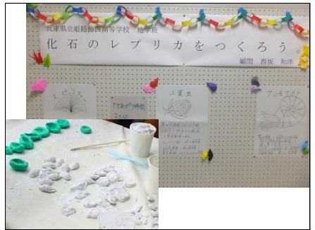
地学班「化石のレプリカをつくろう」 地学班は、石膏を使って化石のレプリカを作ります。地球にいた過去の生物についての説明もします。