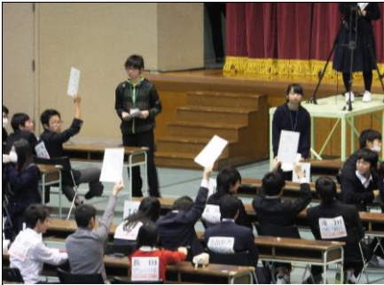
正解かどうか不安の中、提示 確信を持って答えを提示します。しかし、・・・もありました。