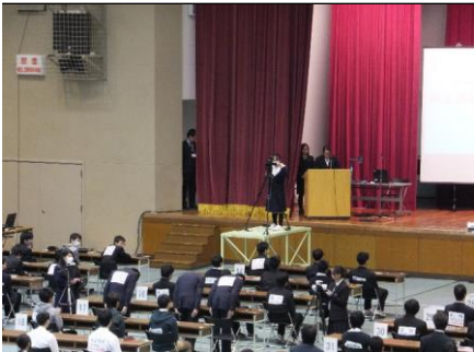
チーム「SSSC」の紹介 「飾西・サイエンス・サーベイ・コース」の略称をチーム名にしました。