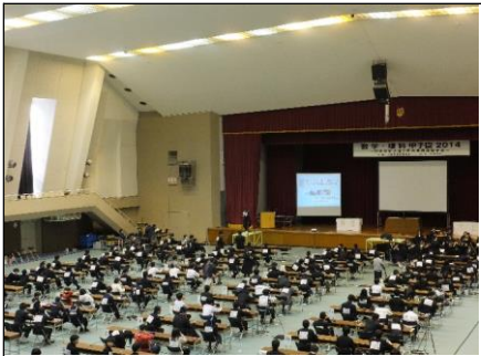
いよいよ始まります! 各校代表者がそれぞれの席に着席しました。

兵庫県教育委員会主催の数学・理科甲子園2014が甲南大学で行われ、2年生・1年生が参加しました。個人戦と団体戦(それぞれ数学分野2題、理科分野6題)の予選で難問に挑戦しました。その後、本選、チャレンジマッチ、決勝が実施されました。