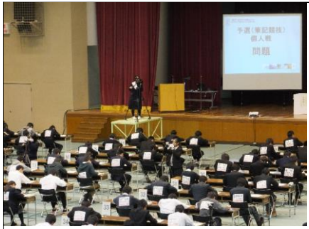
個人戦の開始 予選個人戦は各チーム1つのテーブルに3人かけ、数学と理科の問題を8問解きます。