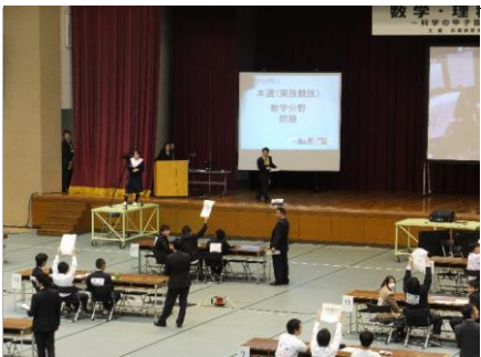
本選(実技)の様子です 数学や理科の難解な思考問題や、工作・実験などで問題に挑戦です。