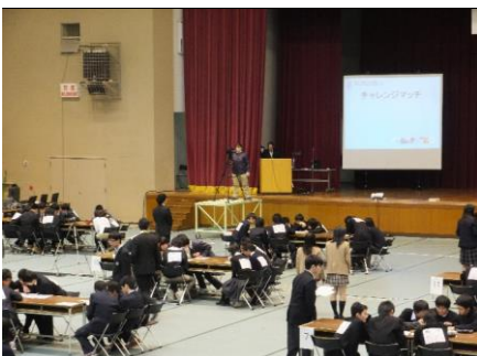
チャレンジマッチの団体戦 チャレンジマッチを含めて、出場メンバーは全員参加。