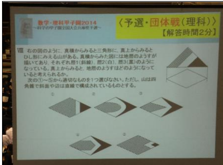
予選(団体戦(理科)) 立体の想像、イメージを膨らませて、メンバー3人の答をまとめます。