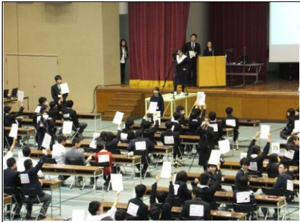
解答を提示します 問題1つに対して、一つずつ解答を提示します。