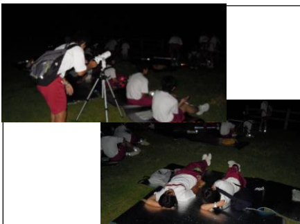
西はりま天文台 天体観測(班別研修)① 小型望遠鏡で天体を観測。シートに寝転んで星空を見上げました。