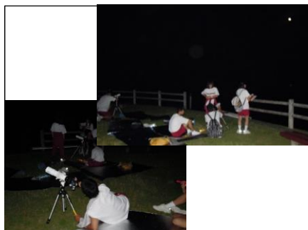
西はりま天文台 天体観測(班別研修)② 月が大きく輝いていました。大変だけれど心地よい夏の夜です。