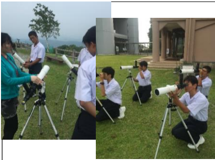
西はりま天文台 天体観測(事前研修) 夜の班別研修に向けて小型望遠鏡の使い方を教えていただきました。