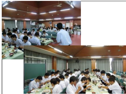
西はりま天文台(宿舎の様子) 夕食をしっかり食べて、夜の観測に備えます。翌日の朝食もたくさんあり、お腹いっぱい。