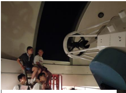
西はりま天文台 天体観測(グループ研修)① 60cm望遠鏡を使って、事前に調べた星を観測しました。