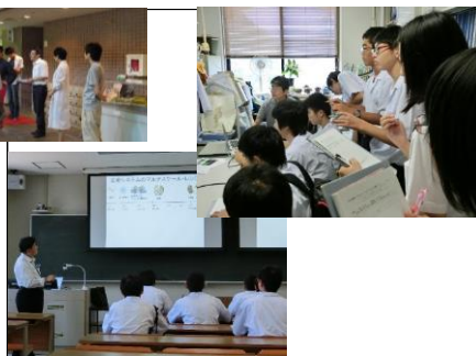
兵庫県立大学理学部 研究室訪問② 生命理学では西谷研究室で生体情報学を、館野研究室で蛋白質機能理論の研究を知りました。