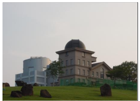
西はりま天文台 (天文台公園) なゆた望遠鏡、60cm望遠鏡のある南館・北館です。