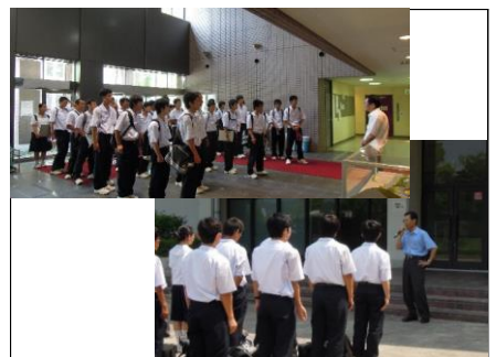
兵庫県立大学理学部研究室訪問③ / 解散式 県立大での研究室訪問が終了しました。無事、学校に到着。事務長よりお言葉をいただきました。