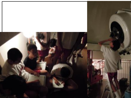
西はりま天文台 天体観測(グループ研修)② 各班ごとに、調べた星について発表し、実際に望遠鏡の操作をしました。