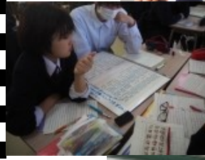
2年生 まなボードを使った 意見交換・英文 の読み解き