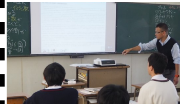
2年生選択 プロジェクターによる 画像の提示