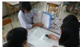
まなボードを使った世界史の演習

「ICT機器や道具を活用した授業の工夫」では、普段の授業でも活用されている大型モニターはもちろんのこと、黒板に貼り付けることができるスクリーンを活用したり、まなボード(小型ホワイト