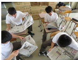
「情報技術の発展と私たちの生活」講座