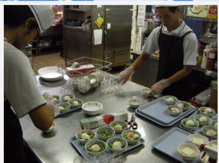
地域・企業での体験・実習