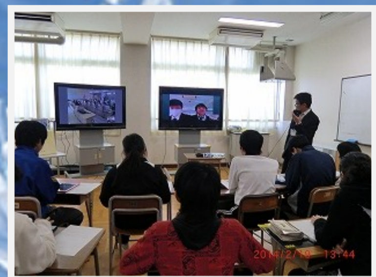
交流及び共同学習